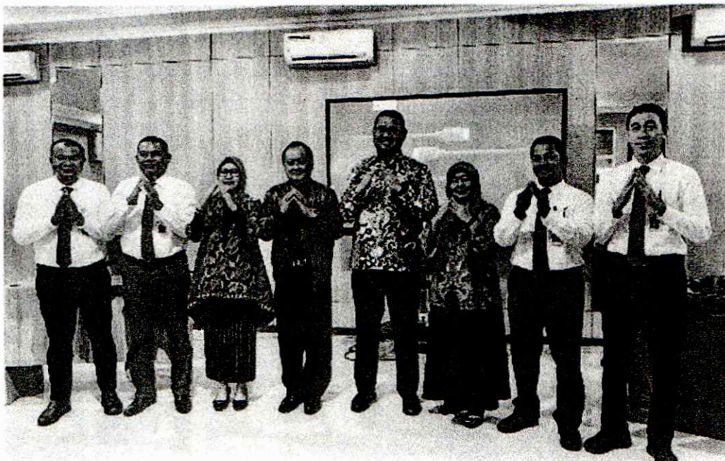
Foto bertamasya Kadispermukiman selenggara peluncuran aplikasi SITANGKAS

Narasitimur - Dinas Perumahan dan Kawasan Permukiman (Disperkim) Halmahera Selatan meluncurkan aplikasi Sistem Informasi Tanggap Kolaboratif dan Responsif (SITANGKAS), Kamis (24/4/2025)