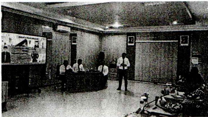
Komisar Jenderal Polisi, Kepala Kepolisian Daerah Sumatera Selatan, saat diundang sebagai SITANGKAS.

LABUHA, TM.com— Dalam rangka mendukung Program bupati dan Wakil Bupati Halmahera Selatan, Dinas Perumahan dan Kawasan Permukiman (Disperkim) Kabupaten Halmahera Selatan meluncurkan aplikasi "SITANGKAS".